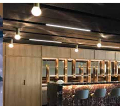
Tribune FC Metz