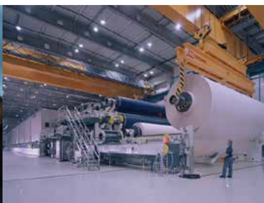
Norske Skog Golbey