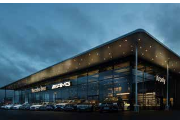
Concession Mercedes – Sausheim