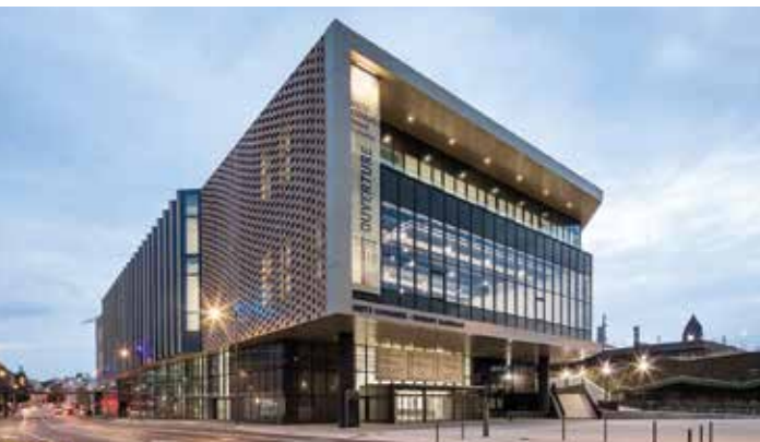
Centre des congrès Robert Schuman – Metz

En connaissance de ces principes, nous avons réalisé de nombreux projets en utilisant des produits qui participent techniquement et esthétiquement à l'architecture de votre intérieur. De la solution la plus classique à la conception de luminaires sur-mesure jusqu'à l'utilisation de produits designs de nos partenaires, nous saurons mettre en œuvre le nécessaire pour répondre à vos attentes.