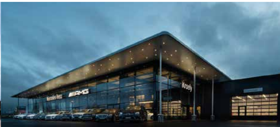
Concession Mercedes – Sausheim