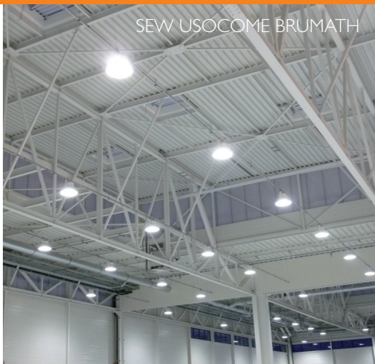
SEW USOCOME BRUMATH